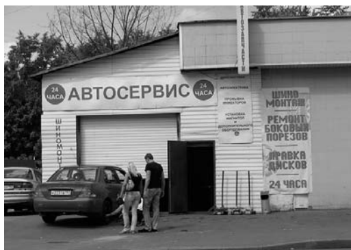
1 – автосервис

3.3. Какой из изображённых на фотографиях объектов может быть размещён на участке, показанном на карте точкой А? Запишите в ответе номер фотографии. Обоснуйте свой ответ.