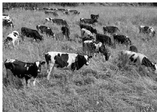
2 – пастбище