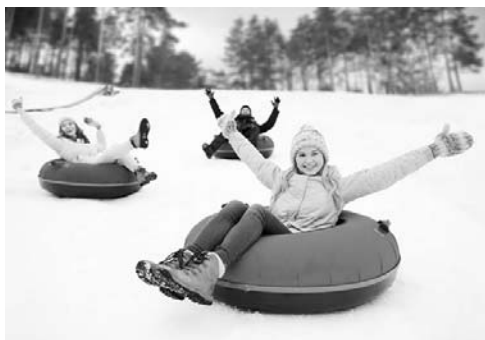
1 – трасса для тюбинга

3.3. Какой из изображённых на фотографиях объектов может быть размещён на территории, по которой проходит маршрут А–В? Запишите в ответе номер фотографии. Обоснуйте свой ответ.