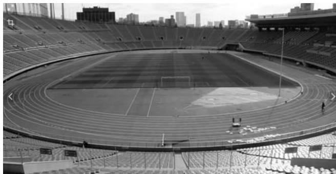
2 – стадион