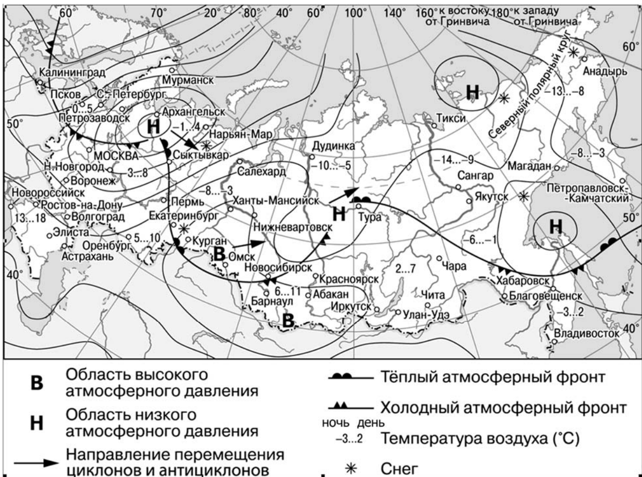
Карта прогноза погоды на 18 апреля (на 15 часов московского времени)

4 С антициклонами весной обычно связана ясная погода. Назовите один (любой) город из числа показанных на карте, погоду в котором 18 апреля будет определять антициклон.